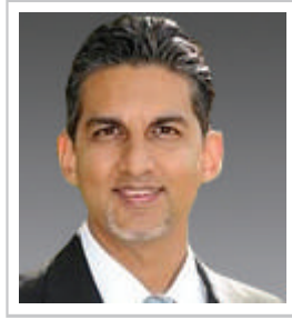
Halim Dhanidina Justice California Court of Appeal, Second District